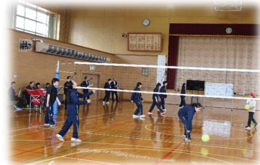
全道へき複大会公開授業の様子