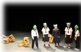
昨年度の演劇祭より